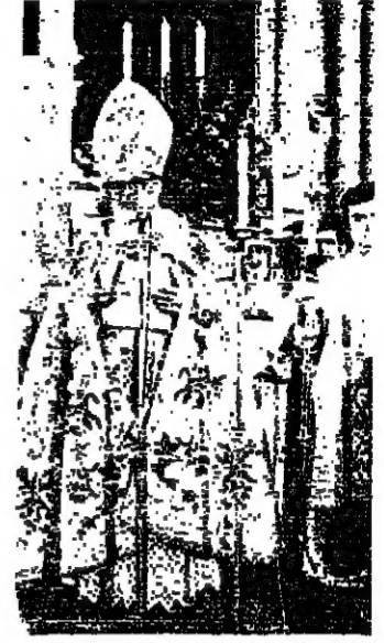
البطريك يلقى خطابه